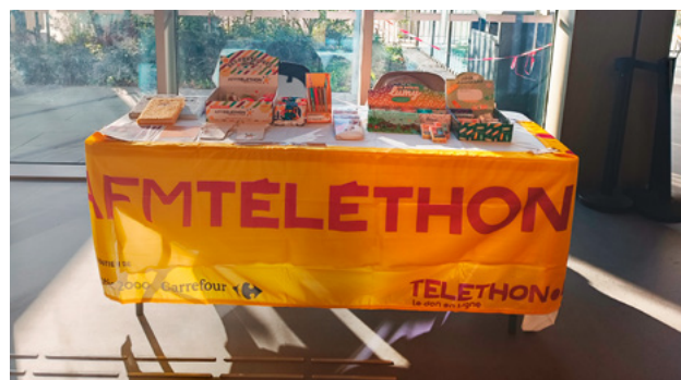
Stand à l'hôpital