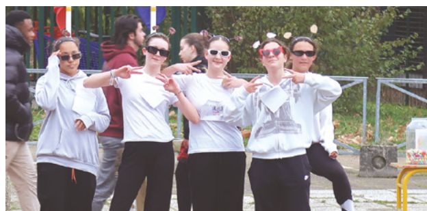
Au lycée- une équipe avant la course