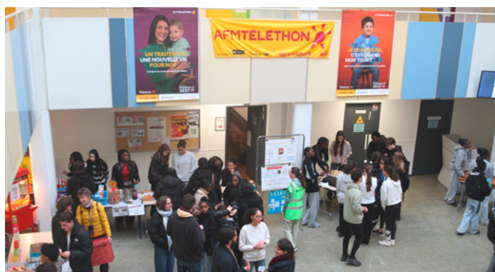
Vente dans le hall du lycée