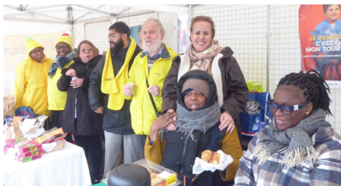
Dimanche- au marché des membres du Collectif