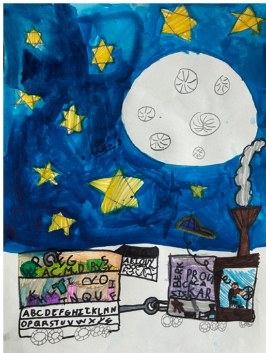
Dessin de Chloé