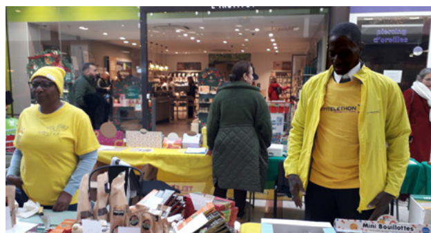
Samedi- Stand Centre commercial Ulis2 et chorale de l'EMU