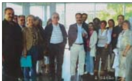
Extrait d'un journal de Sâtão

Le 24 janvier 1997 un protocole d'accord a été signé entre la municipalité des Ulis et le Comité de Jumelage, définissant les liens et les actions avec les villes jumelles.