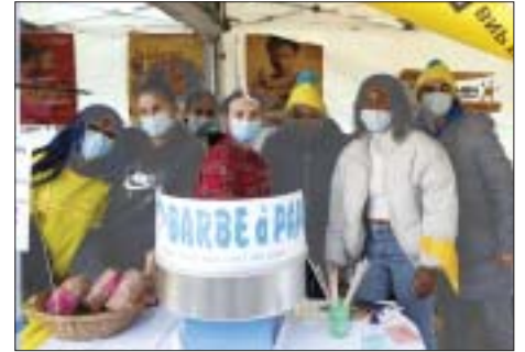
Animations sur le stand et tombola

Au programme, un stand de vente au Centre commercial Ulis 2 le 19 décembre, un autre au centre-ville face au marché le 20 décembre, et une vente de plats à emporter pendant toutes les vacances de fin d'année. Les plats étaient confectionnés par notre partenaire le restaurant La Pajovic , situé au Centre commercial de Courdimanche, spécialisé dans les plats d'Afrique de l'Ouest. Ainsi, vous pouviez déguster un tiép , un mafé ou encore même un yassa pour 8 € tout en soutenant une belle cause.