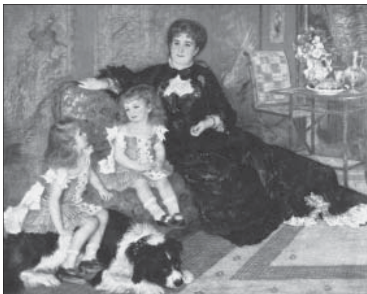
Madame Charpentier et ses enfants, Auguste Renoir 1878, Metropolitan of Art, New York

du Livre de Poche. Son épouse Marguerite ouvre un salon rue de Grenelle que fréquentent peintres, écrivains, politiques sans distinction d'idées. Charpentier, amateur d'art, collectionneur, se veut aussi mécène en apportant son soutien à des artistes et tout particulièrement à Auguste Renoir.