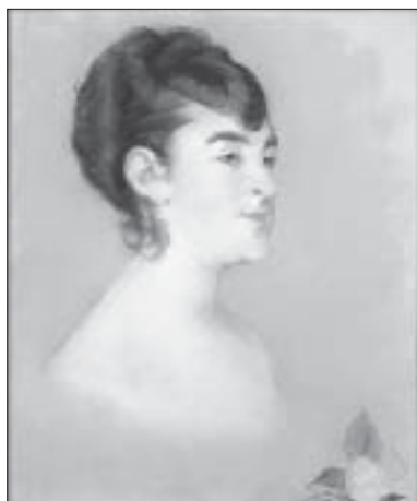
Isabelle Lemonnier pastel 1880, E. Manet

Il est le fils de l'éditeur parisien Gervais Charpentier à qui on attribue la création