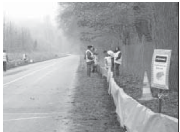
Installation des bâches de chaque côté de la route

L'alerte a été donnée depuis la décennie 1990 et des scientifiques ont démontré qu'un risque résulte de la propagation transcontinentale de spores de champignons qui infectent et tuent ces petits vertébrés.