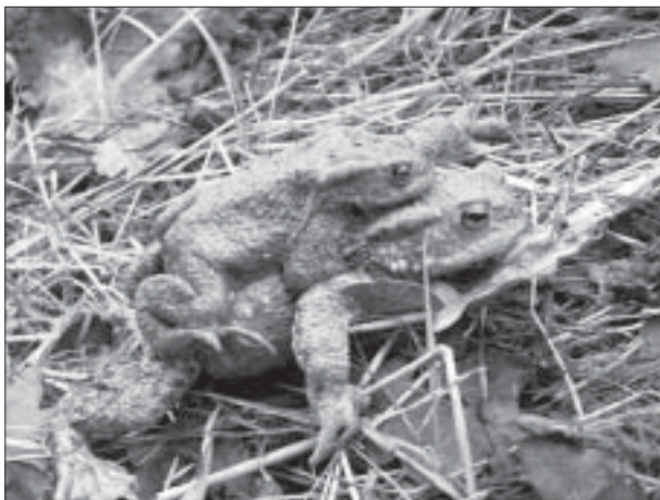
Un petit crapaud mâle s'est déjà accouplé à une femelle, laquelle va le transporter jusqu'à la mare. La fécondation des œufs a lieu pendant la ponte.

Malheureusement, ce périple n'est pas sans danger lorsqu'ils doivent traverser des routes dès la tombée du jour. Des populations entières d'amphibiens peuvent ainsi être exterminées en quelques années par la circulation automobile.