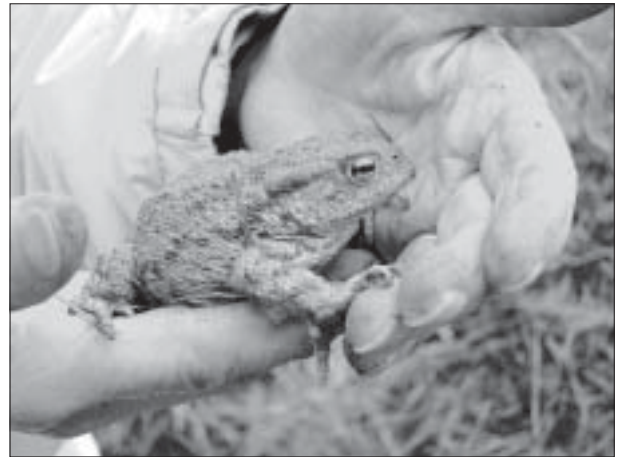
Une femelle crapaud prête à pondre

Si vous désirez aider à la survie de ces amphibiens en aidant au montage du dispositif, en y consacrant quelques matinées, contactez les associations :