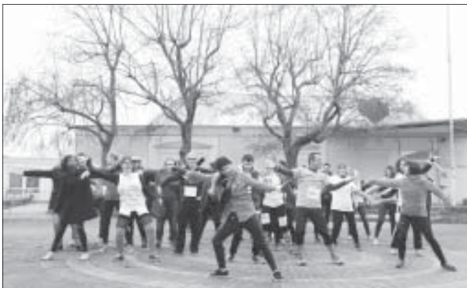
Samedi 3 décembre - Une Flash-mob des élèves du lycée de L'Essouriau