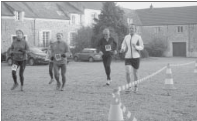
Dimanche 27 novembre - La Belliregardinoise à St-Jean-de-Beauregard

Nous remercions, pour leur appui, les Municipalités des Ulis et de Saint-Jean-de-Beauregard, les services de la ville des Ulis (Vie associative, Sports, Communication, Techniques), l'Hôpital d'Orsay et le Lycée de l'Essouriau, ainsi que STPec.