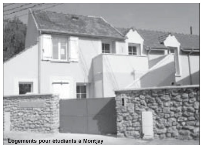
Logements pour étudiants à Montjay

Tél.: 01 69 07 95 45 les-amis.emmaus-les-ulis@wanadoo.fr http://emmaus-lesulis.monsite-orange.fr/