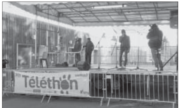
Samedi 3 décembre - Productions du Conseil des jeunes au stade