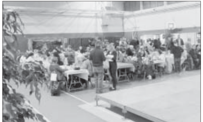
Vendredi 2 décembre - Diner-spectacle au gymnase de Courdimanche