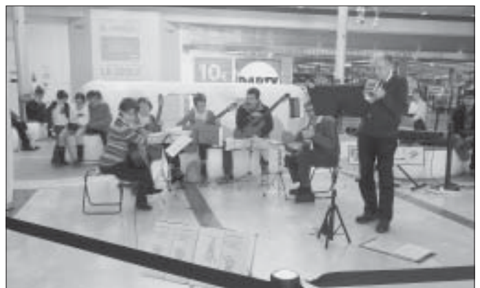
Samedi 3 décembre - Animation de l'E.M.U. - Centre commercial Ulis2

Commerçants des Ulis, Bures, Orsay et Courtaboeuf, en particulier: les boulangers, Hélianthème, Sitis, Carrefour et CC Ulis 2, Kiloutou, Les domaines qui montent, La Part des anges, etc.