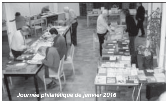
Journée philatélique de janvier 2016