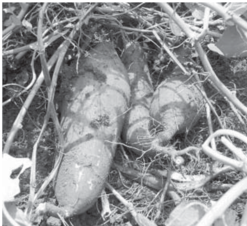
Patate douce - Tubercules juste déterrés, avec des radicelles et des bases de tiges feuillées.

“La patate douce ( Ipomœa batatas ) ou simplement patate est une plante vivace brune de la famille des convolvulacées très répandue dans les régions tropicales et subtropicales où on la cultive pour ses tubercules comestibles. Elle est appelée camote dans les pays d'Amérique centrale, au Pérou et aux Philippines”. Source : https://fr.wikipedia.org/wiki/Patate_douce