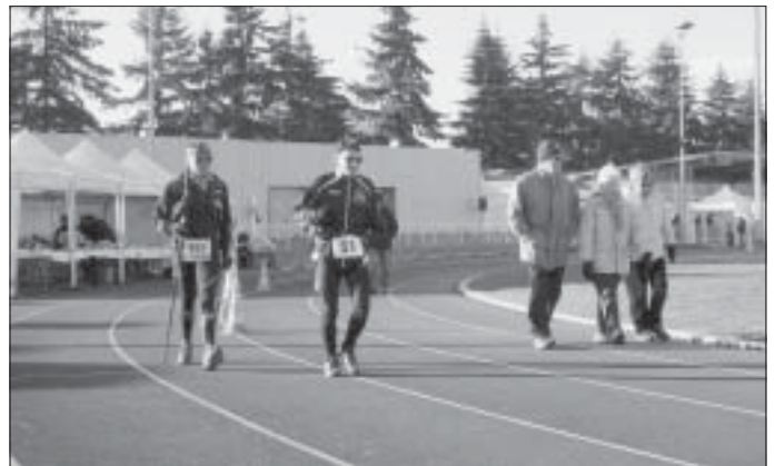
Vendredi 2 et Samedi 3 décembre - 24 h de course au stade J-M. Salinier