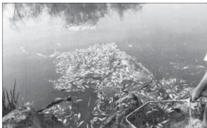
Les poissons flottent, ils sont morts par intoxication... Plus jamais ça !