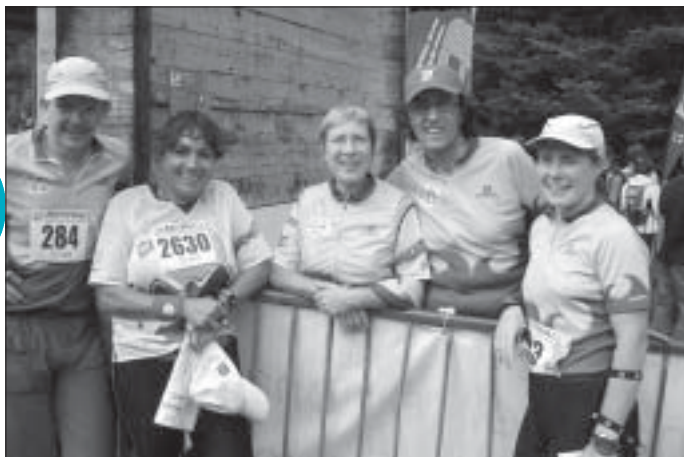
Quelques membres du COPS 91 présents à l'O'Festival, qui avait lieu en marge des championnats du monde de C.O

Tous les membres du club étant amoureux de sport nature, ils vous proposent de pratiquer les sports d'orientation sous toutes leurs formes : à VTT, à pied, à ski, en raid multisports. Il y a même des épreuves dites de O'précision que peuvent pratiquer les personnes à mobilité réduite.