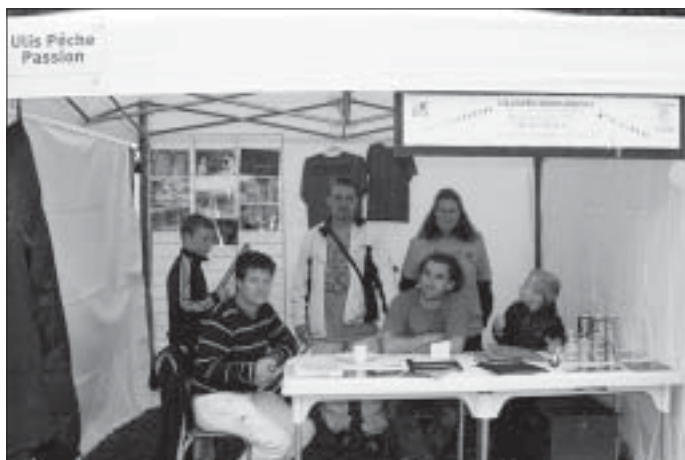
Des membres de l'association lors de la Fête des Ulis, le 11 septembre 2011