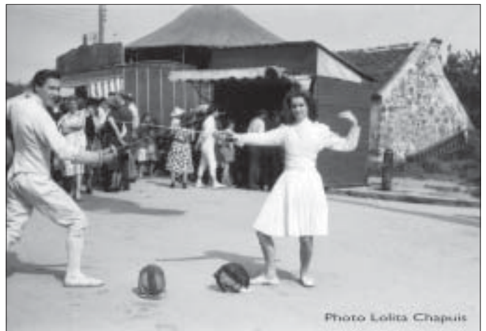
1962 à Montjay - La fête et le fleuret un lundi de Pentecôte. La place avec son lavoir et sa fontaine