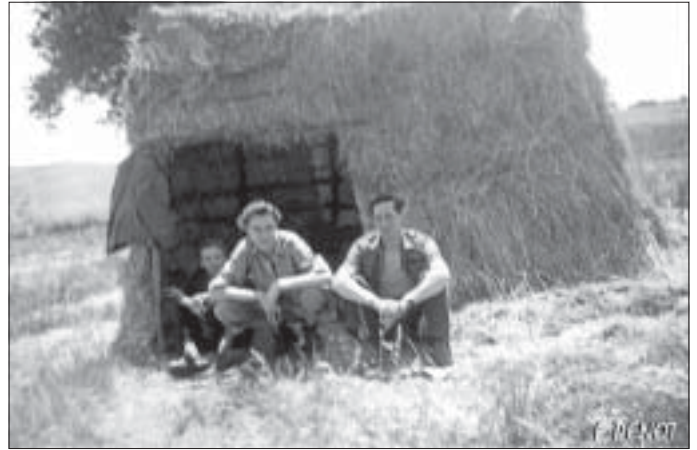
1958 à Montjay - Le refuge des cultivateurs en bordure des champs.