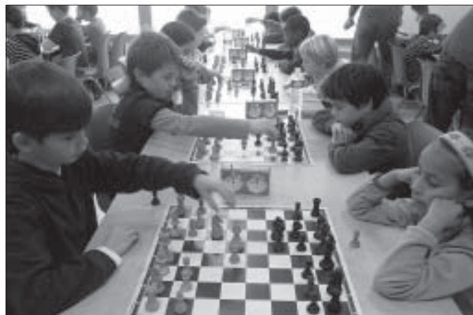
Championnat de l'Essonne les 26 et 27 novembre 2011