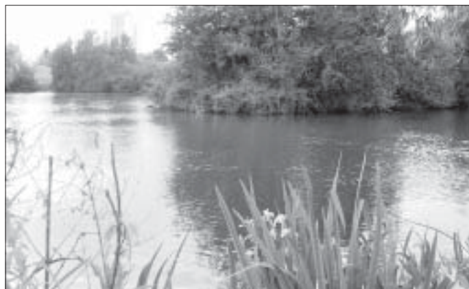
Le lac du Parc Nord est bordé d'arbres et d'iris des marais (fleurs jaunes)

Durant juillet et août, tous les samedis, sauf jours pluvieux, nous étions à la disposition des enfants autour de l'étang à concours, afin de leur faire découvrir la pêche au coup. Par manque d'expérience, nous avons oublié de faire de la publicité (tract et affiche) afin de vous prévenir à l'avance. Cette erreur sera corrigée lors des prochaines initiations.