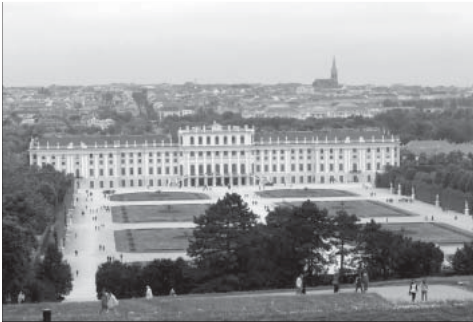
Le château de Schönbrunn et son parc, à Vienne (Autriche)