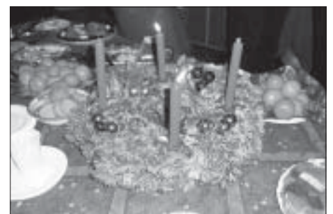
Couronne d'Avent

L'ALCA a un agrément Jeunesse et Education Populaire.