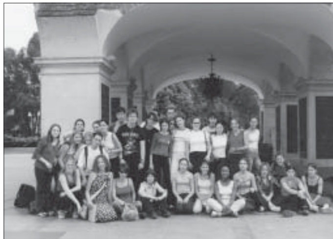
Le groupe de Français et six élèves polonaises (devant le monument aux morts de Varsovie)