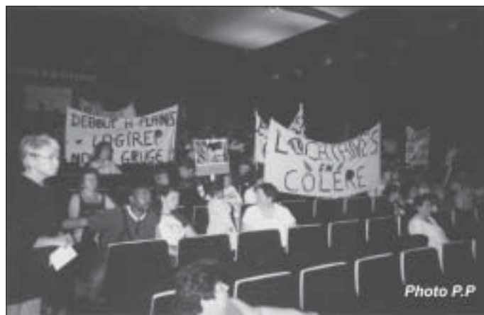
Les habitants s'installent calmement mais n'ont pas encore roulé les banderoles

Ensuite, calmement, près de 150 personnes ont pris place dans le cinéma. Elles y ont retrouvé, d'une part, le Sénateur Maire et d'autres représentants de la municipalité, et d'autre part, les représentants du bailleur. Par contre, le représentant des Pompiers et le Commissaire de Police étaient absents.