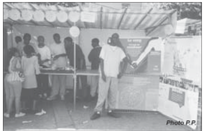
24 juin 2001, stand de « Jeunes et ambitieux » sur la fête aux Amonts : une autre - et très bonne - façon de ne pas « faire des conneries »...

Cependant, l'un des plus âgés, en sweet bleu clair, consent à me répondre, un peu à l'écart, tout en me disant qu'il est « en recherche d'argent » - ce n'est pas moi qui lui en procurerai, sauf en l'aidant dans une recherche de formation et d'emploi, s'il me le demandait.