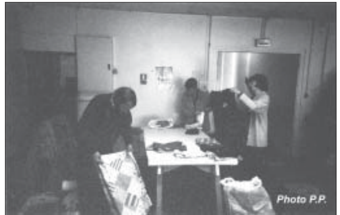
Pendant des semaines, le LCR des Hautes Plaines est une vraie fourmilière. Avant d'être distribués, les dons y sont triés. Ah, si seulement on y voyait clair !

Les dons matériels (vêtements, vaisselle, ustensiles de cuisine, électroménager, mobilier, jouets) ont afflué. Ensuite, pendant la 2 ème quinzaine de juin, tous ces objets ont été répartis entre les sinistrés, au fur et à mesure de leur relogement en appartement.