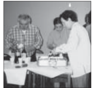
Le 27/01/2001 à la galette du "4C" Le 06/02/2001 au repas du CQCO