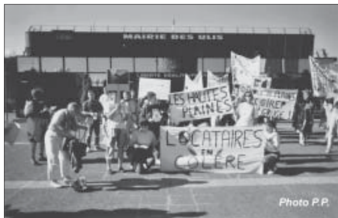
"Liberté Égalité"... Les habitants font aussi preuve de Fraternité et de Solidarité

Un tract a appelé locataires et autres Ulissiens à manifester à travers la ville, le samedi 29 juin, pour exiger sécurité et salubrité dans la résidence, afin que le drame survenu au bâtiment 6 des Hautes Plaines ne se renouvelle pas, puis à participer à une réunion avec le Sénateur Maire, le bailleur LOGIREP, le représentant des Pompiers et le Commissaire de Police.