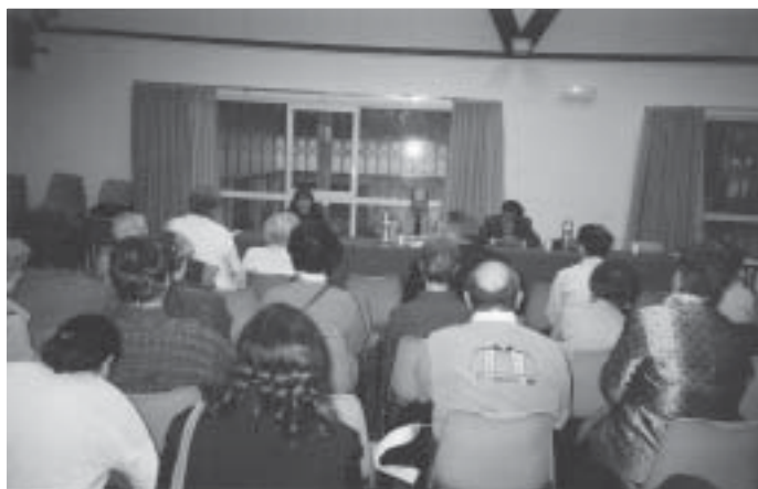
16/11/2002, conférence-débat - Une idée semble éclairer l'assemblée