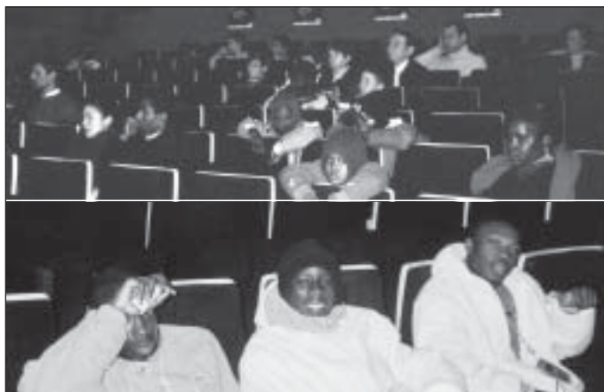
09/12/2002, à Prévert - Salle de tous âges et de toutes origines