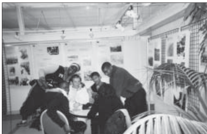
5-16/11/2002, exposition - Collégiens travaillant avec bonne humeur