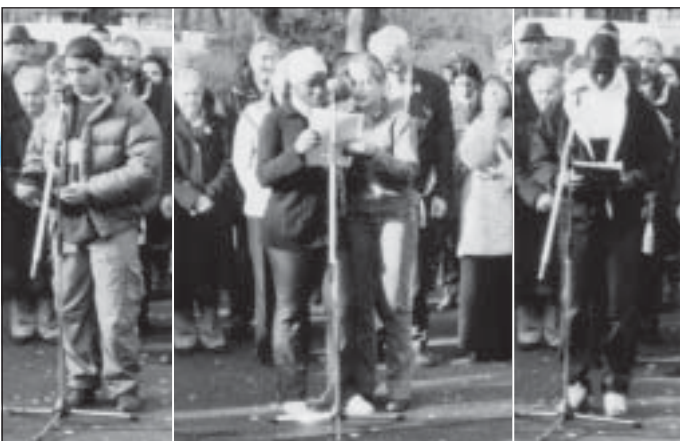
11/11/2002, cérémonie - Maintenant Antoine, Sédiba, Harva...