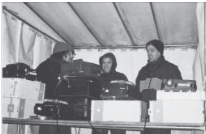
09/12/2002, hors Prévert - Le « Kolektif Alambik » illumine