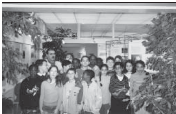
5-16/11/2002, exposition - Écoliers habitués à faire preuve de respect

Tel est le sens de la campagne lancée suite à la proposition faite, le 16 mars 2002, par la section ulissienne de l'ARAC (Association Républicaine des Anciens Combattants et victimes de guerre). Basée sur le partenariat entre cette association, la ville (Secteur Démocratie locale), d'autres associations ( Ulis-Brazzaville , Les Ulis en Mouvement ), des enseignants, des équipements (MPT), les instances participatives (le 4C, les comités de quartier), des citoyens, cette dynamique s'amplifie. À son actif en novembre et décembre 2002 : une exposition, deux débats, une célébration vivifiée du 11 novembre, une participation croissante de jeunes. Et en projet : la paix des étoiles dans les quartiers... Bigre !